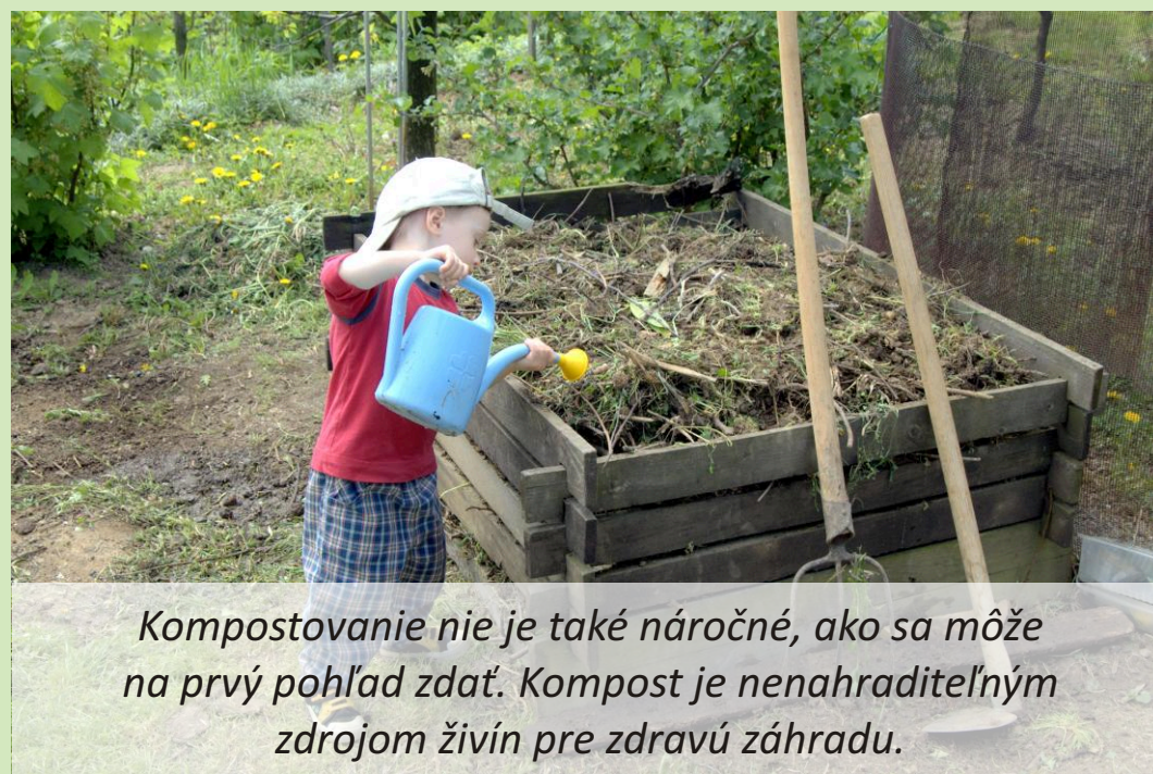
Kompostovanie nie je také náročné, ako sa môže na prvý pohľad zdať. Kompost je nenahraditeľným zdrojom živín pre zdravú záhradu.