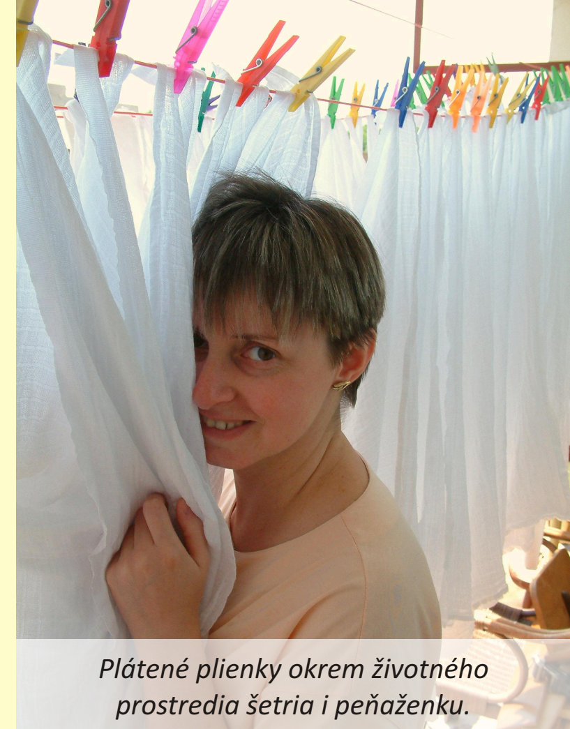
Plátenej plienky okrem životného prostredia šetria i peňaženku.