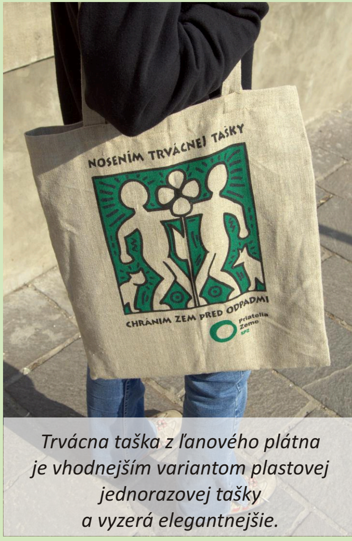
Trvácna taška z ľanového plátna je vhodnejším variantom plastovej jednorazovej tašky a vyzerá elegantnejšie.

1. Predchádzanie vzniku odpadov: Aby sme predchádzali vzniku odpadov, je potrebné menej odpadov vyhadzovať a menej spotrebovať. To znamená, že už vopred premýšľajme, koľko odpadu našim rozhodnutím vytvoríme.