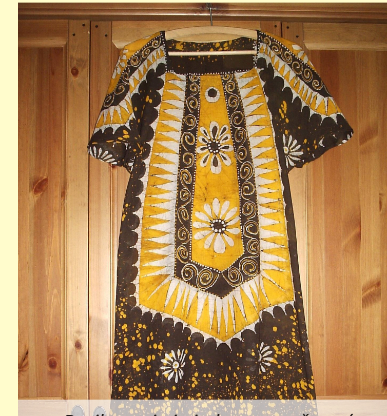
Batikovanie je jednou z možností ako ozvláštniť svoj šatník a zo starej veci tak urobiť novú - za málo peňazí, podľa svojich predstáv a bez zbytočne vyhodenej veci.