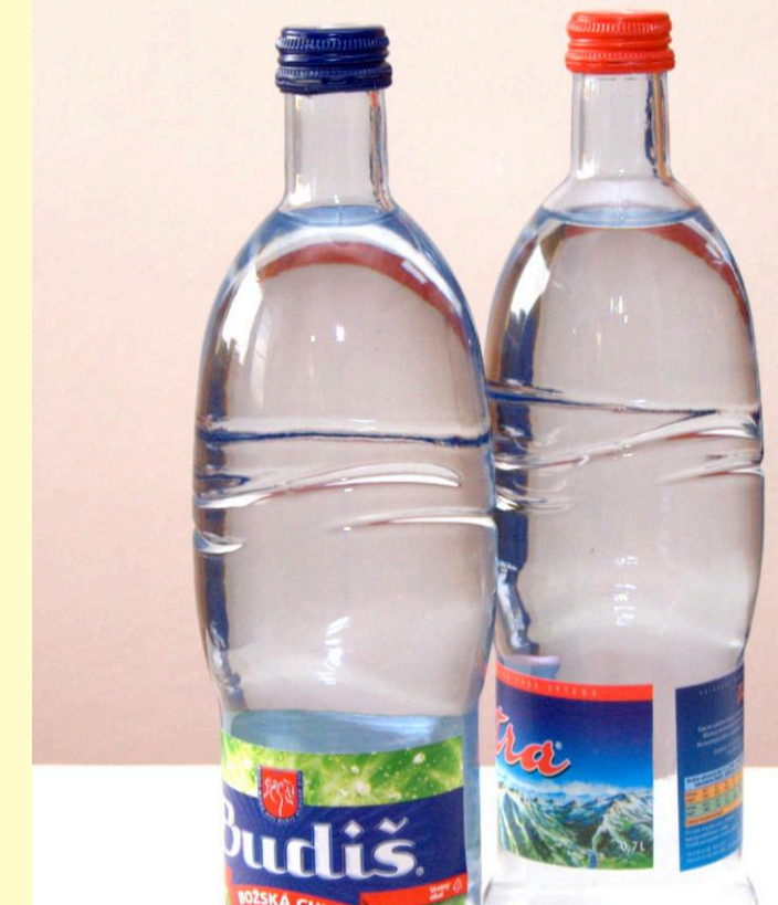
Sklenená fľaša dodá dôstojnosť každému stretnutiu.