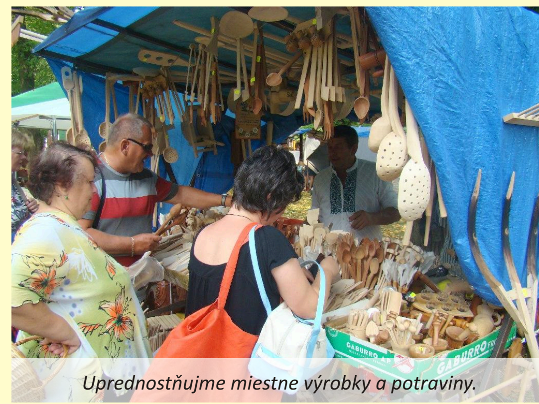
Uprednostňujeme miestne výrobky a potraviny.