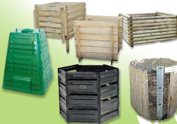
Rôzne druhy kompostérov

Druhým spôsobom je kompostovanie v zásobníkoch. Tie môžu byť z rôznych materiálov (drevo, plast, pletivo, kov, betón, kameň alebo ich kombinácie). Môžeme si ich kúpiť alebo svojpomocne vyrobiť napr. z odpadových materiálov (staré nepotrebné dosky, drevené a plastové palety, staré sudy, pletivo...).